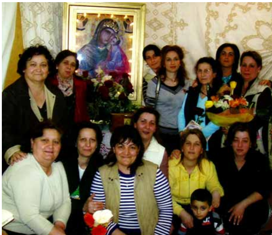
Alcuni abitanti del quartiere Capocolonna Nord omaggiano il quadro della Madonna Greca

L'entusiasmo era alle stelle, tanto da convincere anche quelle persone che erano più restie ad avvicinarsi un po' alla volta a questo importante evento. Queste giornate sono state all'insegna della preghiera. Il programma era così organizzato: lodi al mattino, benedizione delle case con la presenza di Don Edoardo e degli altri sacerdoti; al pomeriggio il Santo Rosario, poi la celebrazione eucaristica e per finire alla sera tardi una veglia di preghiera con canti e la catechesi conclusiva. Ho visto in questi giorni passare tante persone dai più piccoli ai più grandi, dalle donne agli uomini, ognuno portando dentro di se il proprio dolore da offrire alla Madonna. La missione di questo anno è stata particolare perché si è potuto notare una cosa in più rispetto a tutte le altre che abbiamo fatto negli anni addietro e cioè il momento di conversione vera. Tanta gente si è avvicinata all'eucarestia, alla preghiera in modo semplice, ma soprattutto si leggeva nel cuore di questa gente semplice, la sete di Dio che c'era in ognuno di loro. La missione di Maria è stata inoltre quella di