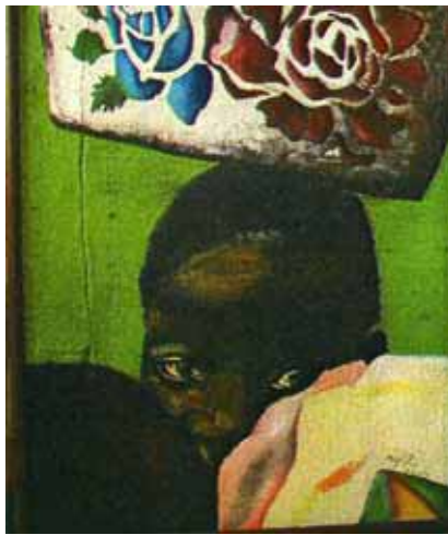
Bimbo d'Africa - Acrilico su tela di iuta