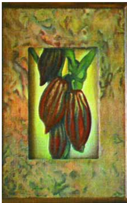
Chicchi di Cacao - Olio su tela tecnica mista

Sicuramente avrà le carte in regola per diventare un grande artista come la mamma, ma soprattutto una persona completa, che riesce a dedicare con passione le sue energie all'arte e alla famiglia.