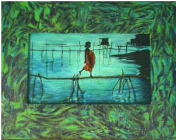
Maternità africana 2 - Collezione privata