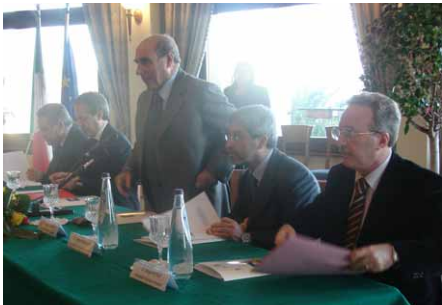
Nella foto in alto il tavolo dei relatori durante la manifestazione

Sono 37 i beni confiscati alla mafia nel territorio provinciale, ma solo 4 ne vengono utilizzati