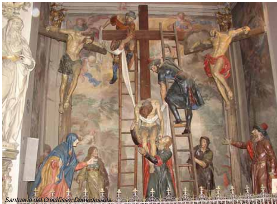
Santuario del Crocifisso, Domodossola

5-La Scrittura ci insegna che c'è più gioia nel dare che nel ricevere (cfr At 20,35). Quando agiamo con amore esprimiamo la verità del nostro essere: siamo stati infatti creati non per noi stessi, ma per Dio e per i fratelli (cfr 2 Cor 5,15). Ogni volta che per amore di Dio condividiamo i nostri beni con il prossimo bisognoso, sperimentiamo che la pienezza di vita viene dall'amore e tutto ci ritorna come benedizione in forma di pace, di interiore soddisfazione e di gioia. Il Padre celeste ricompensa le nostre elemosine con la sua gioia. E c'è di più: san Pietro cita tra i frutti spirituali dell'elemosina il perdono dei peccati. "La carità - egli scrive - copre una moltitudine di peccati" (1 Pt 4,8). Negli Atti degli Apostoli si racconta che l'apostolo Pietro allo storpio che chiedeva l'elemosina alla porta del tempio disse: "Non possiedo né argento né oro, ma quello che ho te lo do: nel nome di Gesù Cristo, il Nazareno, cammino" (At 3,6). Con l'elemosina regaliamo qualcosa di materiale, segno del dono più grande che possiamo offrire agli altri con l'annuncio e la testimonianza di Cristo, nel Cui nome c'è la vita vera.