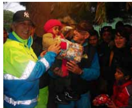
Nelle foto alcuni momenti della manifestazione con gli operatori