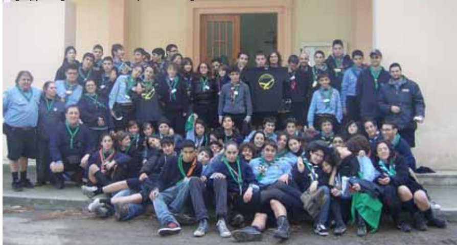
Il gruppo degli scout con i responsabili regionali

dell'operato degli scout: "Il nostro progetto educativo - hanno spiegato - si basa proprio sulla comprensione delle caratteristiche primordiali dell'essere un buon cittadino e la formazione stessa dei più giovani a questo principio. Ci auguriamo di lasciare nei più piccoli, ad ogni incontro un'orma che, con il tempo, pesi sulla gestione del loro essere uomini nel futuro".