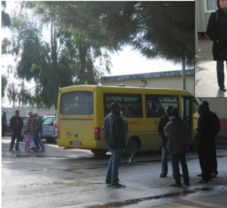
In alto la scolaresca e il pulmino all'arrivo nello spiazzale del Cda